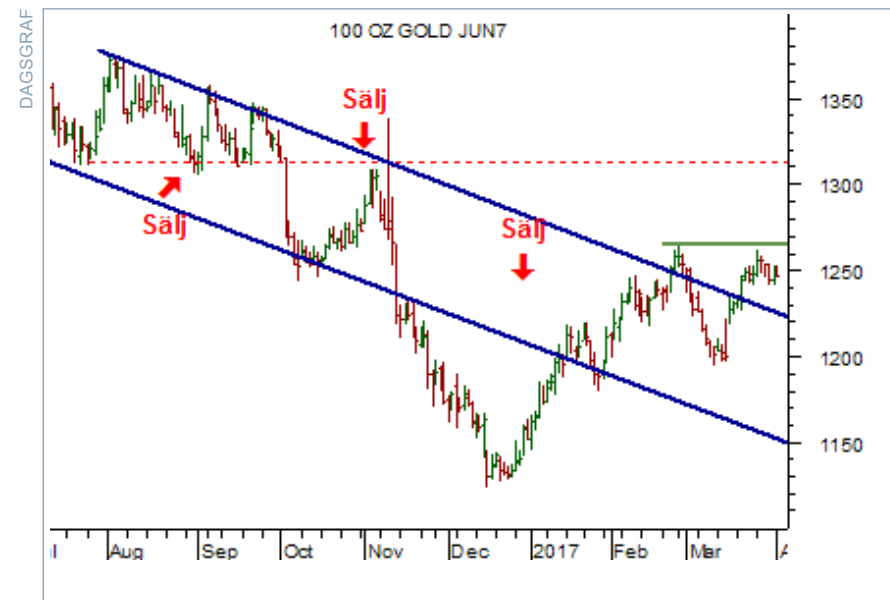
Charts courtesy of MetaStock

Läs mer om BT Multi Portföljen med 70 procent träffsäkerhet här!