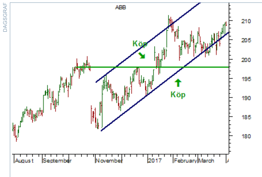
Charts courtesy of MetaStock