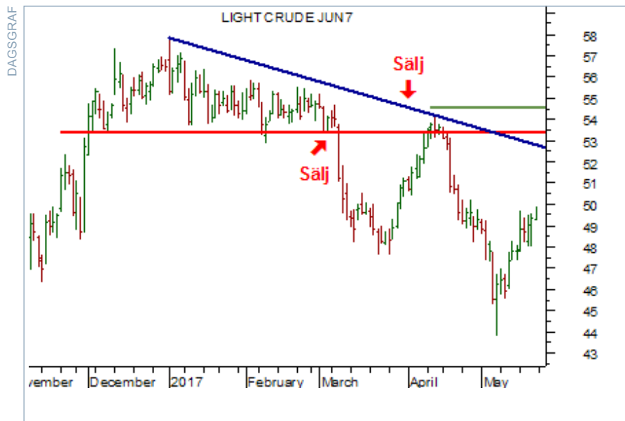
Charts courtesy of MetaStock