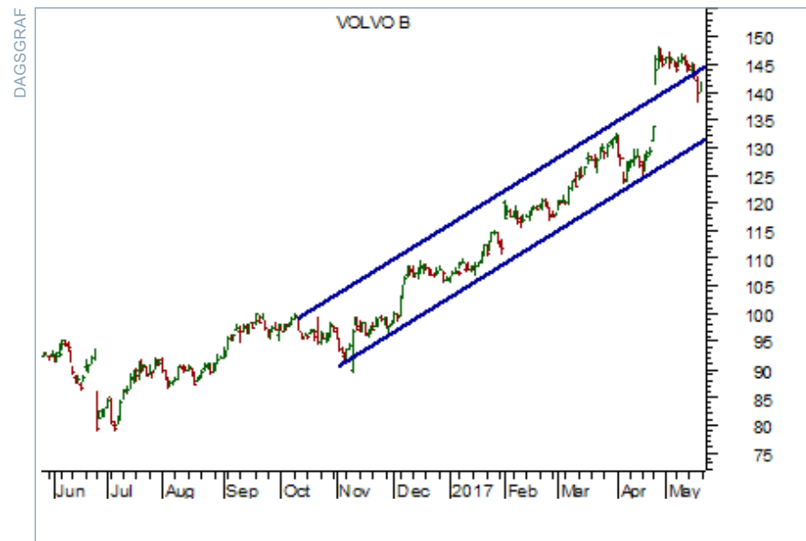
Charts courtesy of MetaStock

Köp BT Multi Portföljen som gjort +50% på kapitalet sedan januari 2016 här!