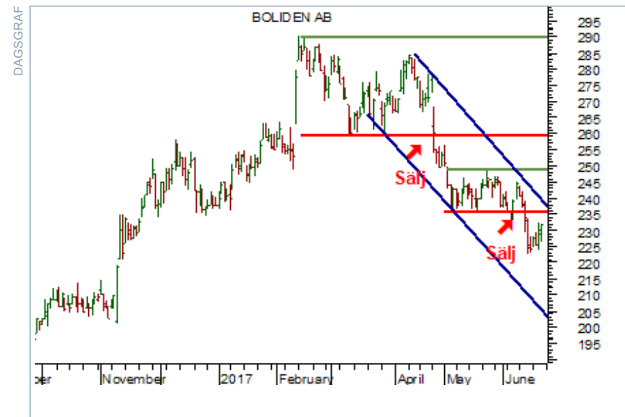
Charts courtesy of MetaStock

Köp BT Multi Portföljen med 70 procent träffsäkerhet här!