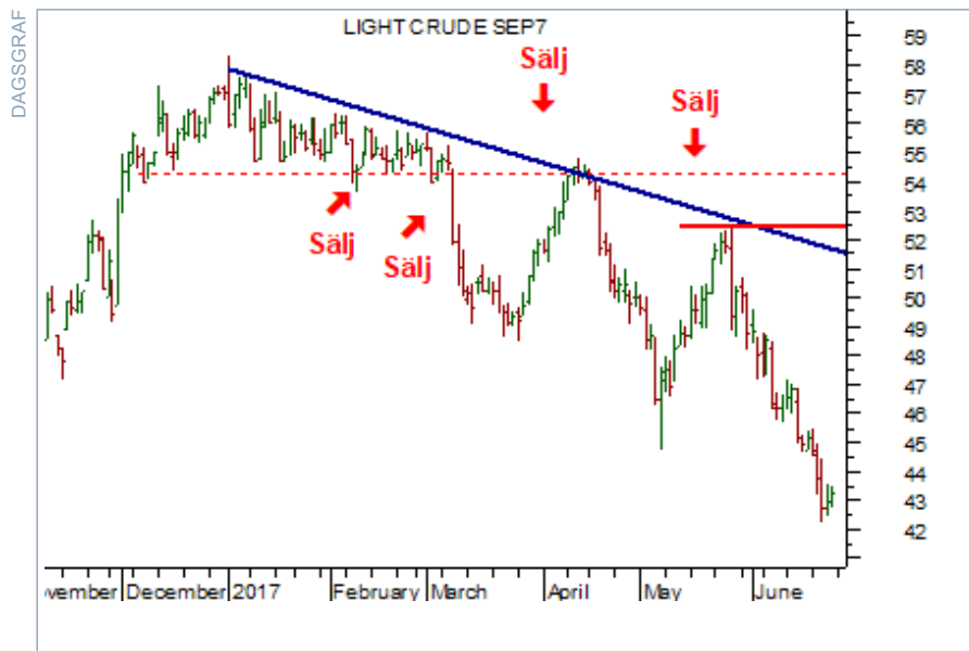
Charts courtesy of MetaStock