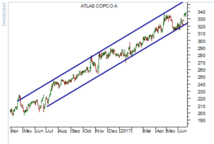
Charts courtesy of MetaStock